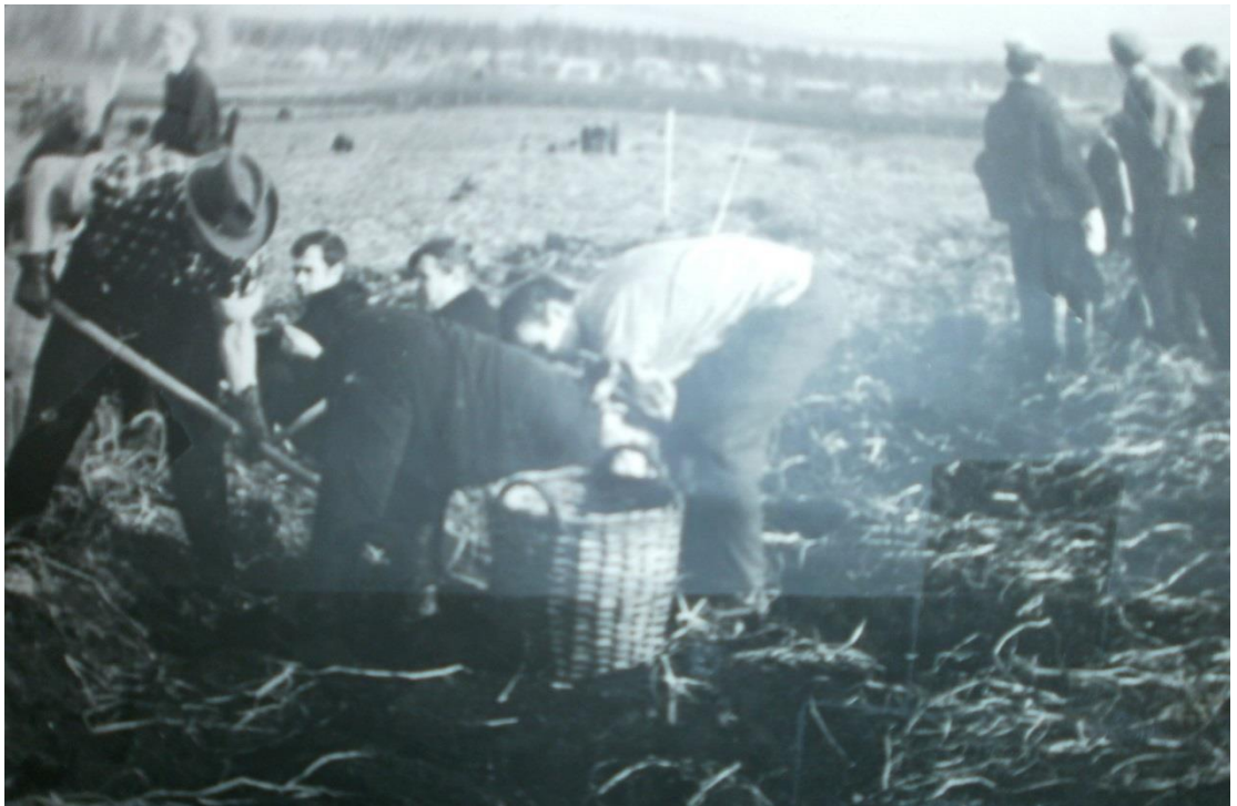
Учащиеся школы на уборке урожая.