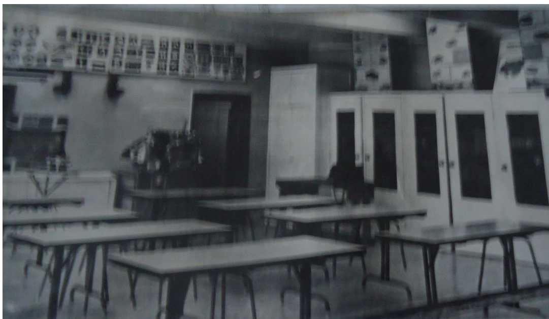
Швейные мастерские для девочек.