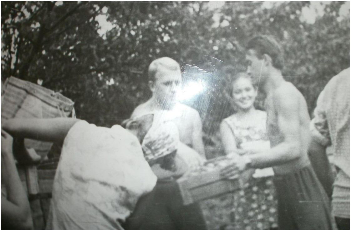
Пятая трудовая четверть. Уборка урожая в Краснодарском крае