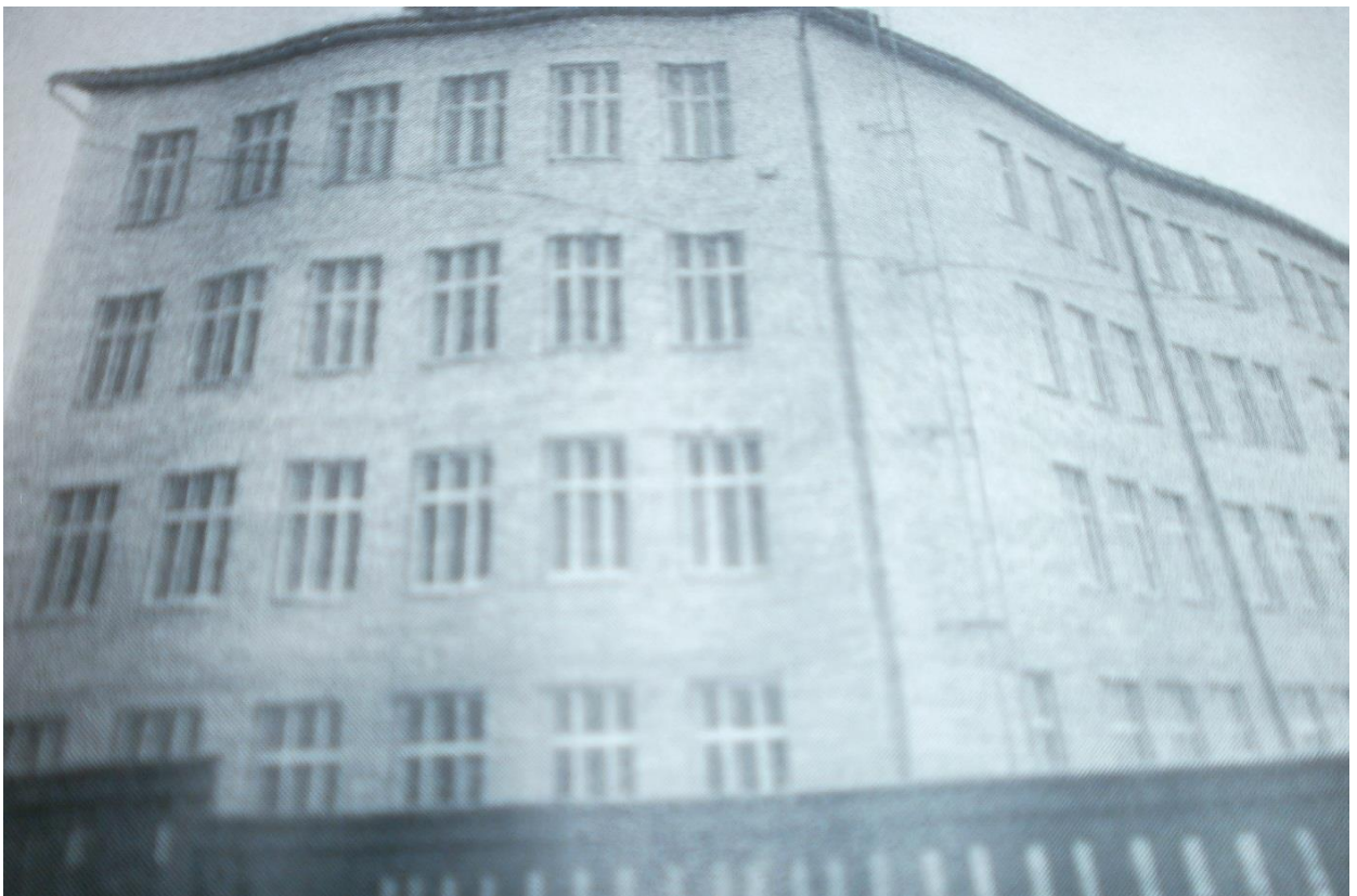
Проект школы № 115 на 880 мест был разработан в Государственном институте проектирования. Автор проекта: архитектор М. Йошпа, соавтор: инженер Д. Калинин, инженер: Шапиро.