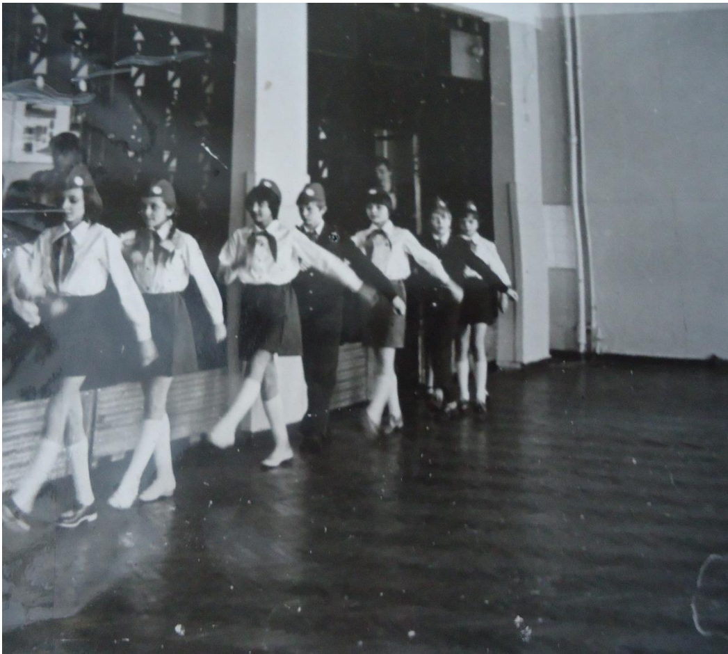
Смотр строя и песни.