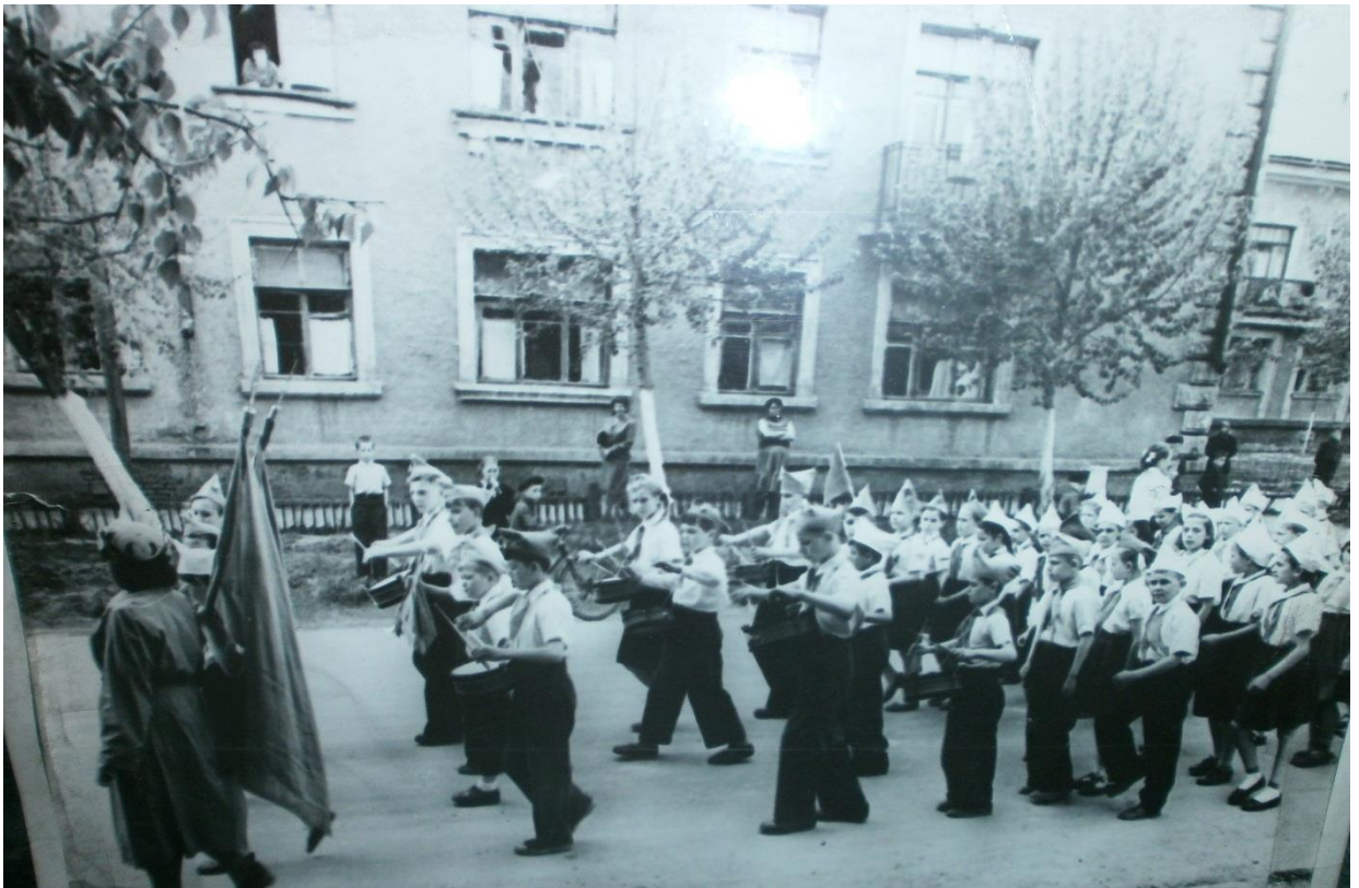
Марш пионерии 19 мая.